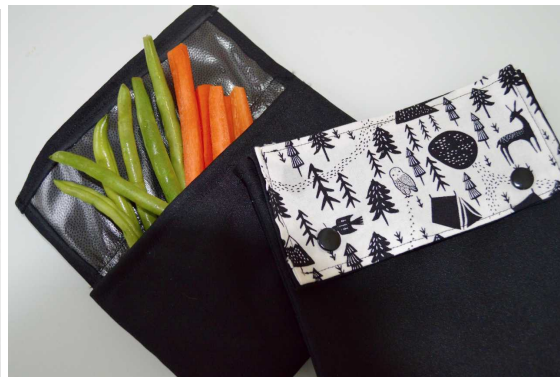
Ensemble de deux sacs à collations/sandwich de 16x17 cm vendu au prix de 17,40$